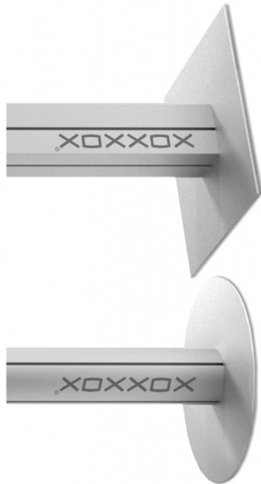
BODENPLATTE ROUND BODENPLATTE QUADER